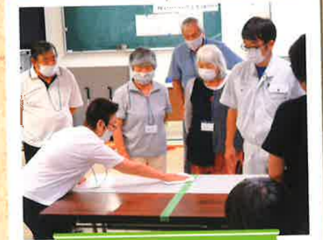
クリーンスタッフ講習

高齢者の特徴と介護予防や日常生活支援サービスについて学び、介護分野での就業をサポートする講習です。