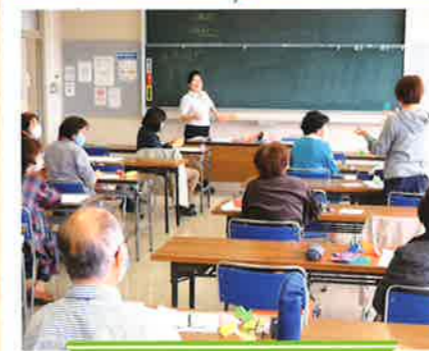
学童保育従事者講習

放課後児童クラブや子育て支援制度について学びます。学童分野での就業をサポートする講習です。