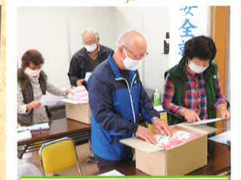
商業施設(スーパー・店舗)バックヤード講習

食材の準備や下ごしらえ、簡単な盛り付け等の調理補助業務に必要な知識を実習を通して養成する講習です。