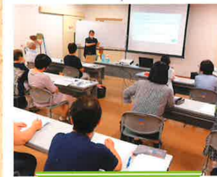
家事援助サービス講習

放課後児童クラブや子育て支援制度について学びます。学童分野での就業をサポートする講習です。