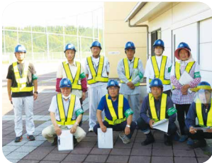
玖珠町SC 安全就業担当委員