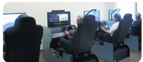
運転業務をおこなっている会員に対して自動車学校で教育訓練を実施 豊後高田市シルバー人材センター

派遣会員教育訓練は、労働者派遣法で入職時やキャリアアップのための教育訓練が義務付けられているため、DVD 貸出による集成型研修のほかに令和4年 10月より連合会のホームページに設置されたe-ラーニング「派遣会員専用教育訓練」を利用して教育訓練を行っています。自動車運転適性診断については、65歳以上の運転業務に従事している派遣会員に独立行政法人自動車事故対策機構（NASVA）や自動車学校にて安全運転講習を受講してもらっています。