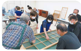
障子・網戸の張替え講習