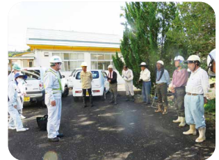
豊肥地域SC 作業前の安全確認