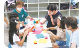
放課後児童クラブ就業体験