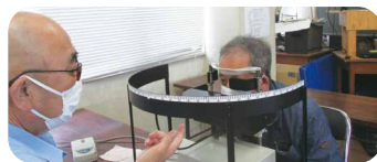
視野検査↑ 視力検査↓