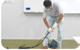
刈払機取扱安全講習