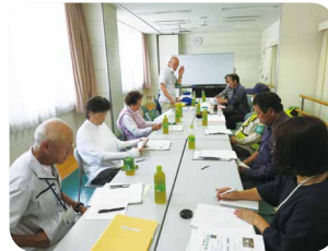
玖珠町SC 安全パトロール後安全会議