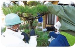
松の剪定技能講習