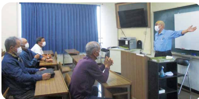
豊肥地域派遣教育訓練