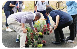
ガーデニング講習