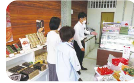
店舗販売就業体験