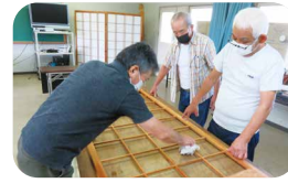
障子・網戸の張替就業体験