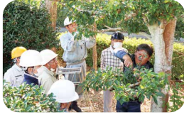
樹木の剪定技能講習