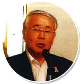
大分県商工労働部河野理事兼審議監