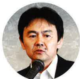
加賀商工労働部審議監