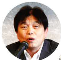
帯刀商工農政部長